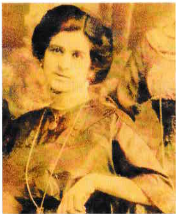
Bunica de mamă