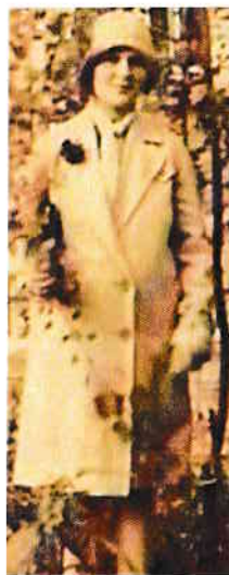
Eu, la minus trei luni